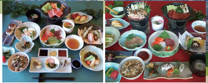
地産地消食事メニュー例

コロナ禍を経て、「身土不二」という言葉が見直されています。「自分の身体と土は一体であり、自分の住んでいる国、土地でとれたものを食べよう」という考え方です。